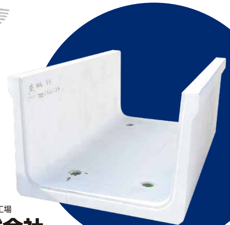
鉄筋コンクリート 大型フリューム