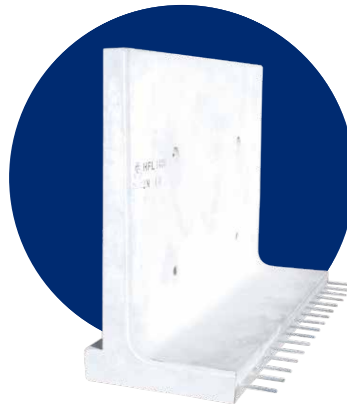
鉄筋コンクリート L型水路

郡山営業所 〒963-8047 福島県郡山市富田東4丁目46 リュミエール富田1-G TEL (024) 983-6008 FAX (024) 983-6009